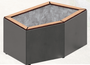
Banquette Le Caire