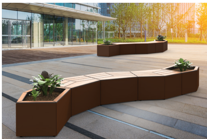
Réf. 209670 + 209671