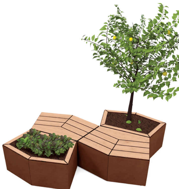
Réf. 2 x 209670 + 2 x 209671