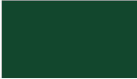
Vert 6005 « Vert mousse »