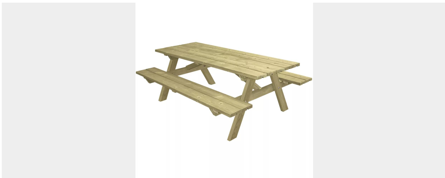
TABLE DE PIQUE-NIQUE MUNICH EN BOIS POUR COLLECTIVITÉS

UGS : ME-CONF-TAB-MUNICH | Catégories : Aires de Repos , Aménagement Urbain , Le Bois Classe 4 autoclave , Mobilier , Parcs & Jardins , Sports & Loisirs , Tables de pique-nique |