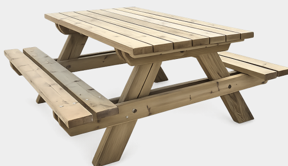
TABLE PIQUE-NIQUE FORESTIÈRE 6 PLACES EN BOIS

UGS : ME-CONF-TAB-FOREST | Catégories : Aires de Repos , Aménagement Urbain , Le Bois Classe 4 autoclave , Mobilier , Parcs & Jardins , Sports & Loisirs , Tables de pique-nique |