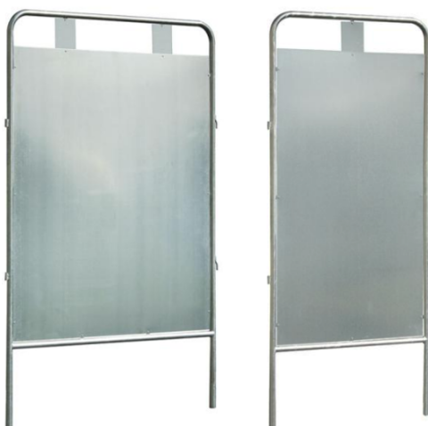
2 candidats / 1 candidat